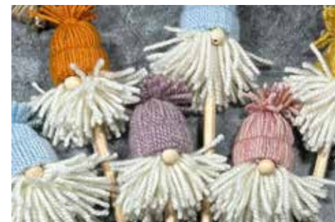
Lutins scandinaves sur un crayon