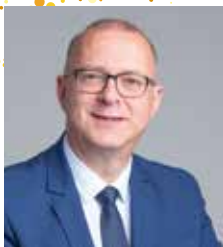
Damien MESLOT Maire de Belfort