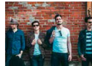
The Freaky Buds - Blues éclectique et rock Mercredi 14 août à 20 h

7, 14, 21 et 28 août : à partir de 20 h • gratuit