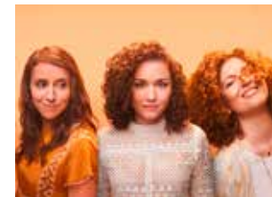
Balaio - Musique brésilienne festive et colorée Mercredi 28 août à 20 h