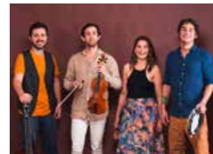
Bloom - Jazz vocal Mercredi 21 août à 20 h

Repli à la Maison du Peuple en cas de pluie