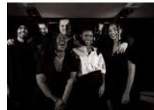
Chains of soul, hommage à Aretha Franklin Mercredi 7 août à 20 h

Les inconditionnels Mercredis du Château reviennent cette année avec pas moins de 4 dates pleines de promesses. L'association Bonus Track propose à nouveau un plateau artistique Jazz de qualité, varié, qui vous épanouira les esgourdes.