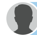
NC Direction de l'aménagement Grands projets structurants Aménagement urbain Prospective