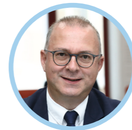
Damien MESLOT Maire de Belfort Président de Grand Belfort Communauté d'Agglomération