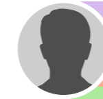
NC Direction de l'urbanisme Droit des sols Contrôle des ERP Architecte conseil