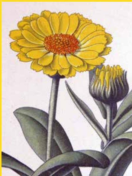
Atlas des plantes de France par A. Masclef, 1891-BMB-U630